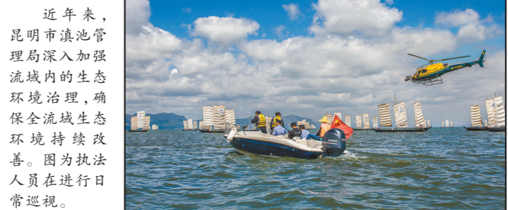
近年来,昆明市滇池管理局加强流域内的生态环境治理,确保流域生态环境持续改善。图为执法人员在开展日常巡查。

积极推进信息化、自动化平台,助力监测管理。 开展滇池综合管理信息平台建设,编制完成《滇池综合管理信息平台建设实施方案》。推进滇池流域河道生态补偿水质水量自动监测站建设,已完成新运粮河、西边小河、新宝象河3条试点河道7个考核断面水质自动监测自动监测站的建设,其他河道生态补偿断面水质自动监测站建设也在积极推进中。