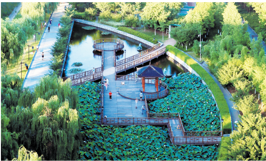
水清岸绿的汉阳江滩

琴断口小河是武汉新区六湖连通工程“引江济湖”的源头,引水端琴断口闸与汉水相接。为改善琴断口小河水质,汉阳区打响“迎春行动”碧水保卫战,抓重点、补短板、强弱项。加速琴断口小河综合整治工程、局部改造工程、污水管道工程、金福路南侧污水管道工程建设。对朱家老港黑臭水体采取应急处置措施,通过河道增氧技术、微生物固定富集技术、底泥固定化和稳定化技术、生态浮床净化技术等对水体进行净化,快速消除河道水体黑臭现象,逐步恢复水体的健康生态系统,改善水