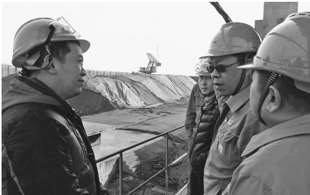
天津市今年以来进一步加大对工业企业落实重污染天气应急响应措施的检查力度。图为重污染天气预警期间环保部门督查人员在重点企业检查企业落实应急响应措施情况。

绿色发展明显加快。全市加快调整产业结构、能源结构,严格控制钢铁、建材、煤电等行业产