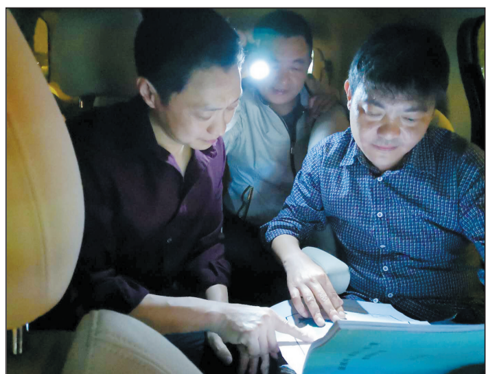
地点:从四川省内江市威远县界连镇返回住地途中 时间:二〇一八年三月三十日晚九点三十五分