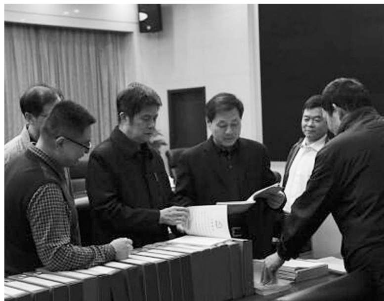
图为山东省环保厅副厅长管言明(右三)陪同省委省直机关工委督导组,督导检查省环保厅“两学一做”学习教育常态化制度化推进落实情况。

“党建工作就是凝心聚力的一股绳,通过建设过硬党支部,打造环保战线坚强堡垒,激发出团体的战斗力,再难啃的骨头都能拿下!”管言明对记者说。