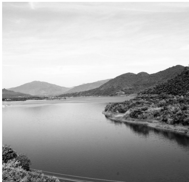
图为位于红线区的三亚赤田水库,目前禁止任何开发和人类活动。