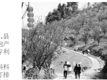
萍乡市乡下村生态修复后的“阳光花海”。

设立科技创新“引导基金信贷通”,县区别设立工业陶瓷、电瓷、花炮产业扶持基金。2017年,萍乡市专利授权量增幅列全省第一。 日前,萍乡市吉润花炮新材料科技有限公司与北京理工大学签订排他性的战略合作协议,引进“硝化纤维素制备火药”专利技术,建立花炮环保新材料生产基地,用硝化纤维素替代“黑火药”“硝药”,破解花炮产业发展“安全”“环保”两大世界性难题。 自2015年4月成为全国首批16个海绵城市建设试点城市以来,萍乡市海绵城市建设成效明显,完工项目121个,面积达26.511平方公里,城市水生态系统得到重塑,玉湖、萍水湖等重点项目开始发挥作用,正逐步实现“小雨不积水、大雨不内涝、水体不黑臭、热岛有缓解”的目标,城市生态环境得到明显改善。 借力全国海绵城市建设兴起的浪潮,江西萍乡龙发实业股份有限公司试水海绵产业,投入5000万元引进两条生产线,每年“吃干榨净”近80万吨陶瓷废渣、煤矸石,生产出的生态陶瓷透水砖供不应求;同时打造环保成套设备,进军绿色环保产业。