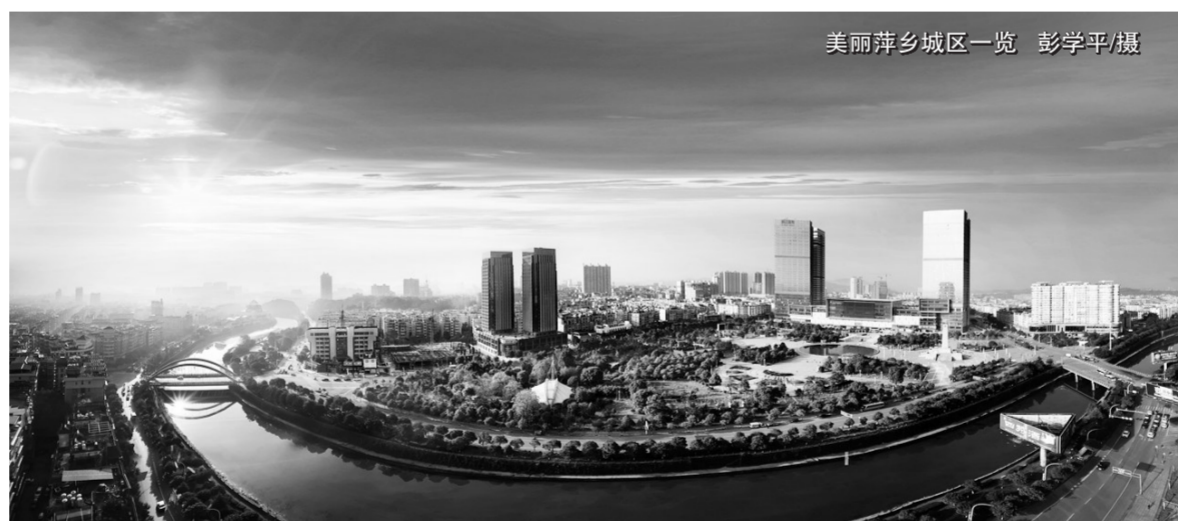
美丽萍乡城区一览

萍乡市以落实中央、省级环保督察整改为抓手,化压力为动力,着力推进产业转型升级,走绿色发展之路,以知耻而后勇的态度坚决打好环保翻身仗。