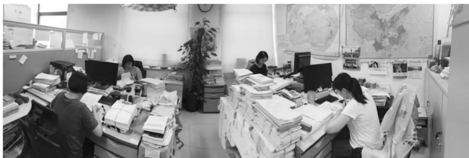
时间:2018年6月12日 20时 地点:中国环境出版有限责任公司某编辑室

高高垒起的书稿,埋头工作的身影,这是中国环境出版有限责任公司一个编辑室中的场景。她们是出版集团第五党支部的几名年轻党员。