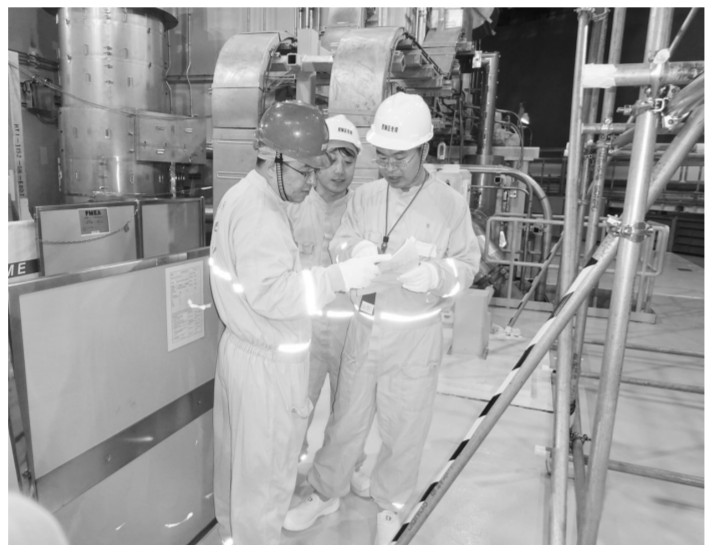
时间:2018年6月21日 21:30 地点:山东海阳核电厂1号机组反应堆厂房首次装料现场

监督二处党支部坚持以党建促业务,争创核安全监管示范“窗口”,总结形成“五步工作法”,提升监督出实效。以AP1000机组监督为例,自开工以来,监督二处共组织100多次监督检查,调试试验监督选点676个,提出了近1000项监督要求,有多人一年出差天数超过220多天。纵观核电厂监督,无论是检查次数还是监督要求数量,无论是监督人力投入还是监督见证点数量,均在国内核电厂的监督实践中创下多个第一。