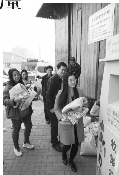
时间:2018年3月26日 地点:环境大厦“地球站”旧衣回收箱

近年来,中国环境报社经营党支部开展了为云南贫困山区孩子捐赠学习用品、为重病孤儿捐赠物资等扶贫助困捐赠活动,组织所有党员和入党积极分子捐款捐物,在增强党组织凝聚力的同时,促进广大党员积极参加公益活动,传递了积极向上的正能量。