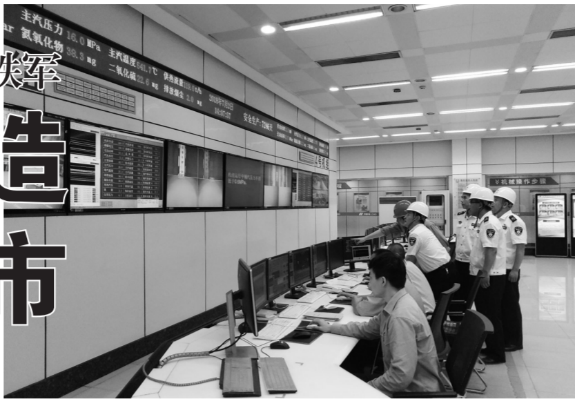
山东省青岛市环境执法人员在青岛华电检查燃煤锅炉环保设施运行状况。