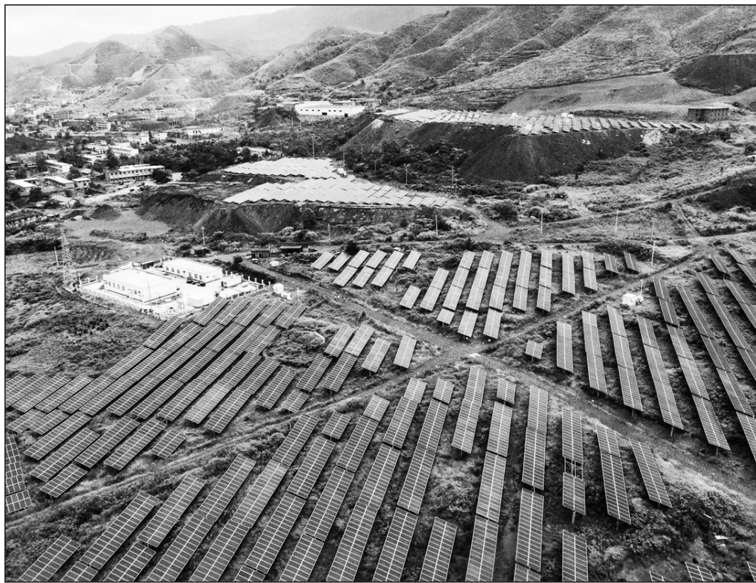
湖南省桂阳县近年来加快矿山修复、矿山复绿,同时还建设了20兆瓦光伏发电场,年均发电量1905万千瓦时,每年产生效益近2000万元,既让矿山重现生态美,还增加了村集体收入。

据悉,安徽省环科院将作为安徽省环保贷具体工作承担单位,在技术审核、项目受理、跟踪项目、宣传推广实施等方面开展下一步工作。