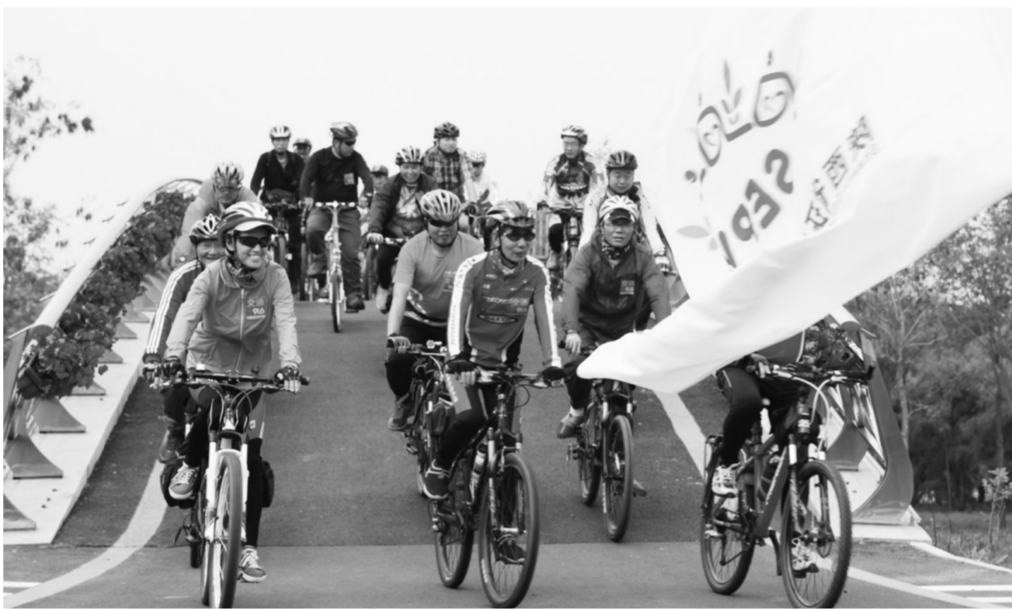
无车日期间,陕西省组织开展无车日骑行活动。