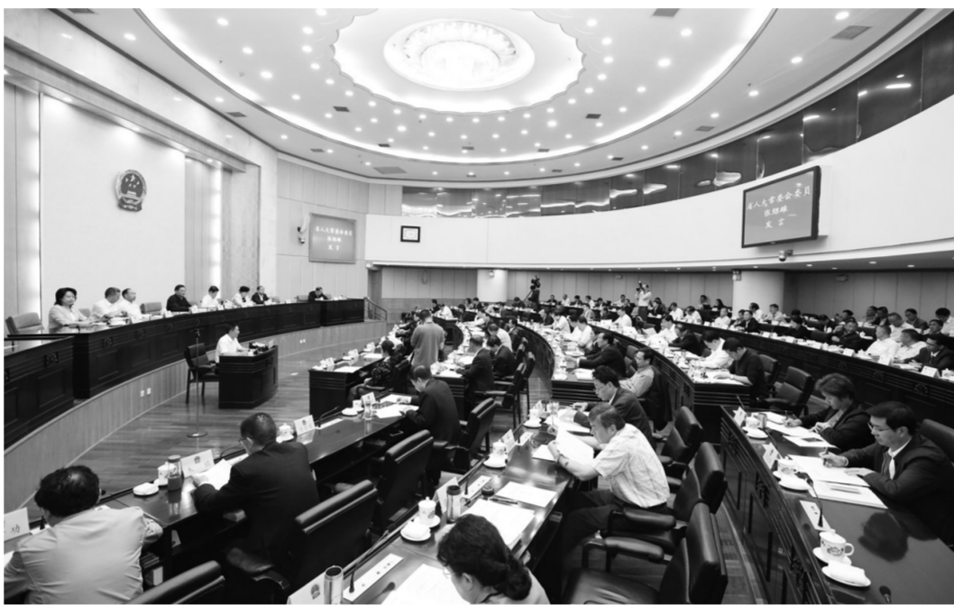
图为云南省十三届人大常委会第五次会议联组会议现场。

进行评议时,重点发言人都表示对省政府及有关职能部门开展的环境保护工作总体满意,《报告》实事求是,完全赞同。他们还有理有据地分析当前存在主要问题和困难,对进一步加强和改进