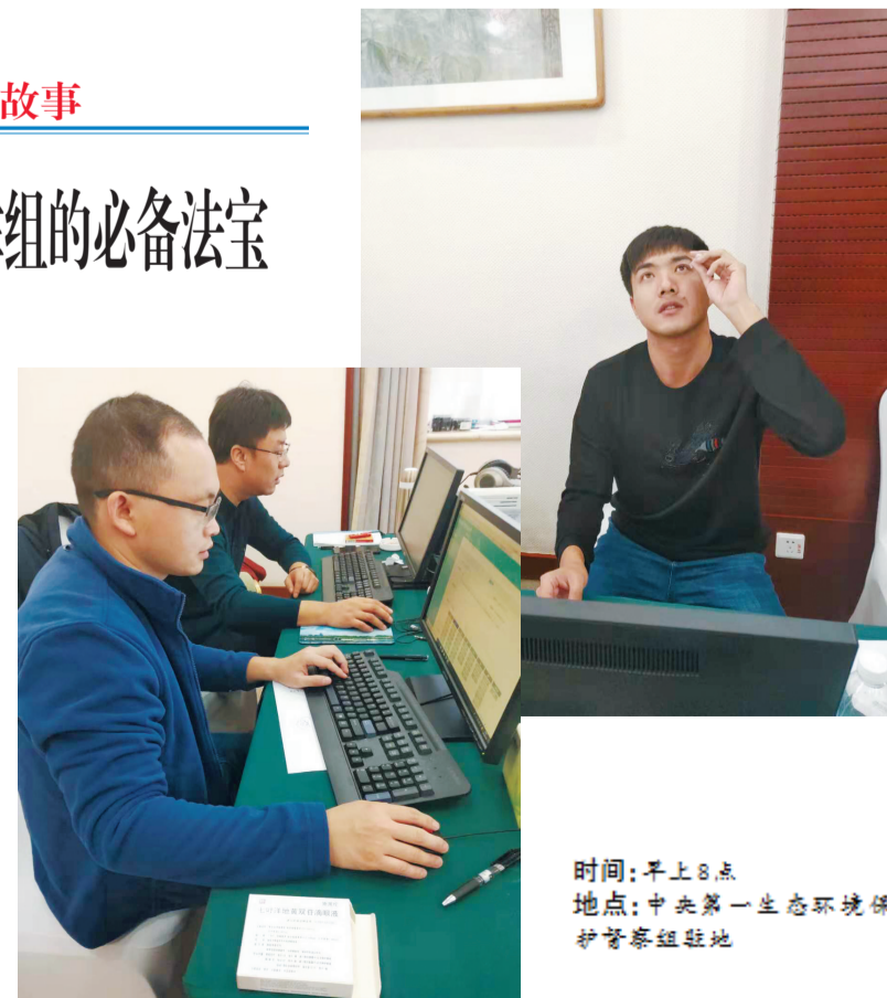
时间:早上8点 地点:中央第一生态环境保护督察组驻地