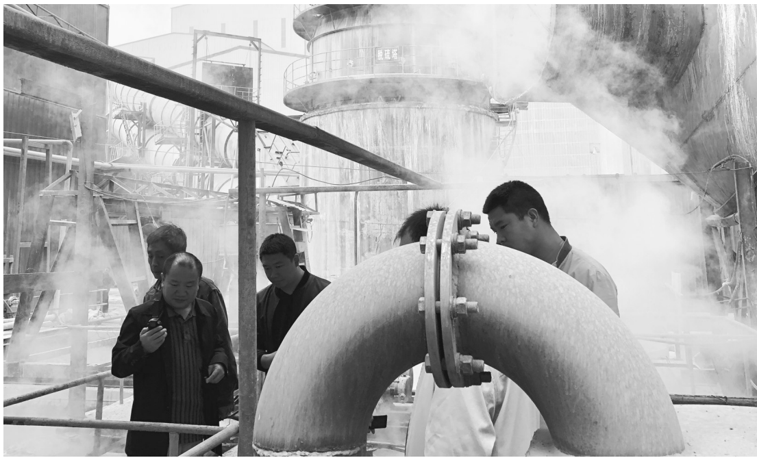
图为驻石家庄执法检查组开展现场检查。

紧盯问题整改,河北省建立起了现场移交、文件督办、电子督办3种督办整改机制,截至11月11日,交办各地的2272个环境问题已完成整改1668个,整改完成率达73.4%。