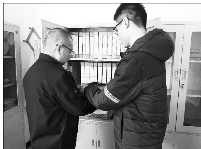
河北省石家庄市桥西区在第二次全国污染源普查工作中,建立了细致完备的档案资料,全区共排查出274台生活源锅炉、72家工业源、1处入河排污口、1处集中式污染治理设施。 郭运洲

为治理施工扬尘污染,南和县对城区范围内的22家建筑工地安装视频和PM 10 在线监控装置,并实现联网运行。今年8月,南和县还建起了秸秆禁烧高空视频监控巡查系统,通过高科技技术实现对全县农田、村庄24小时不间断监控,及时发现燃烧点及时查处。 王娟