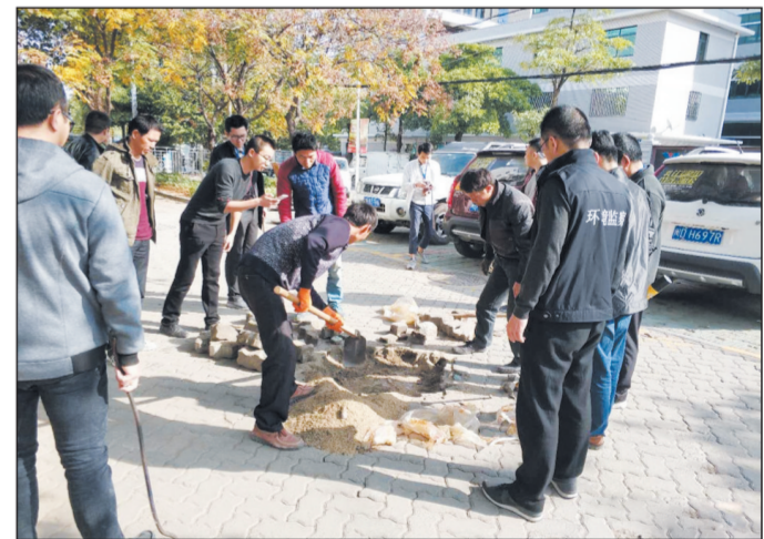
福建省厦门市环境执法支队今年结合大练兵扎实推进执法工作,坚持将日常执法、专项行动与大练兵有机结合,有效打击了环境违法行为。图为执法人员监督某工人开挖疑点处。

同时,要探索构建部门联合监管执法机制,在油品质量、机动车尾气、餐饮油烟、秸秆露天焚烧、槟榔熏烤等方面实施联合执法;要做好土法槟榔熏烤清理整治工作;提前介入建议市县政府、公安部门抓紧开展今年烟花爆竹禁燃工作;另外还对做好移动源污染防治等工作进行了精心部署。