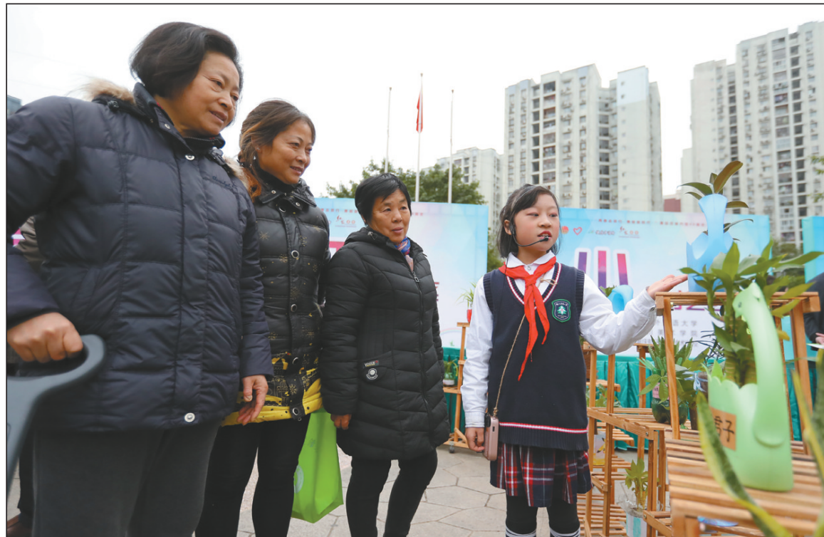
重庆市沙坪坝区树人思贤小学日前开展变废为宝创意手工制作活动,引导学生利用身边的废旧物品做手工,培养学生的环保意识。图为一名学生在展示环保创意作品。

来自秘鲁、埃塞俄比亚等国环境部门相关负责人以及来自科研院所、非政府组织和企业等机构代表就加强应对气候变化南南合作、促进共同发展和实现绿色低碳可持续发展进行了交流。