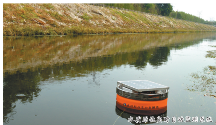
水质原位实时自动监测系统

以人为本是创新的源动力。为了控制水体污染,国家在河流湖库建设了数千座水质自动监测站,在水污染企业排放口安装了逾5万台在线监测设备,并委托第三方进行运行维护。在这些监测站点的运行过程中,无论是管理部门还是运维公司,监测仪器的准确性是共同关注的焦点。监测仪器是否处于正常工作状态?是否在办公室一个指令,即可知晓监测仪器的运行状态是否正常,方便、及时、高效、省人力、省费用。