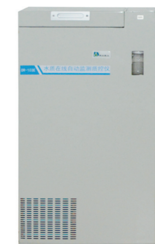
图为DR-103E水质在线自动监测站。

远程水质在线智能质控系统是一种能够检查水质在线监测仪器是否工作正常、分析数据是否有效的质量控制系统,是全国首家分布式质控系统。这一系统已取得国家软件著作权、实用新型专利,并获得中国环境保护产品认证证书,是当前唯一取得认证的分布式质控仪。