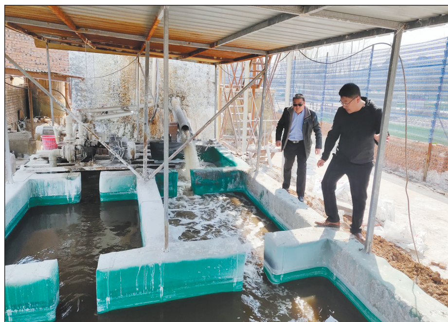
山东省济宁市生态环境执法人员以全面完成国家和省下达的环境质量改善任务为目标,坚持巡查、抽查、夜查相结合,高频次、高密度深入厂区车间,严查严防环境违法行为。图为执法人员在企业污水处理设施旁查看废水净化情况。

要依法严惩违法行为,对非法排放、倾倒、处置医疗废物涉嫌犯罪的,及时移送公安机关依法追究刑事责任。开设“曝光台”,发布权威信息,曝光违法现象和整改进展,形成舆论监督合力,有力震慑环境违法行为。黑龙江省生态环境厅强调,各市(地)要严禁“走过场”式检查和野蛮执法。对在检查中敷衍了事、有案不查、有案不移,以罚代管、以罚代刑,弄虚作假、纵容包庇的,一经查实,将依法、依纪严肃追究、问责;情节严重者,涉嫌失职、渎职的,将依法移交司法机关追究刑事责任。