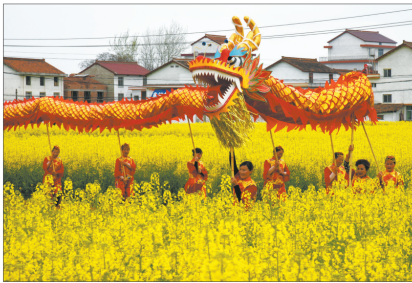
位于汉中盆地的陕西省洋县现在已是油菜花的海洋。今年当地因地制宜推广有机油菜、有机稻米、有机蔬菜的种植,靓丽的风景带动了全域旅游,让不少村庄的收入翻一番。

同时,全面铺开环保专项行动。2018年,相继开展了工业污染源百日攻坚等8次专项行动。57家回潮石材企业已全部关停、拆除主要生产设施,并兑现补助款;西滨军垦农场136家外租企业,已关停70家,符合过渡性生产并完成环保自主验收手续的66家;清退湾河河口违法围垦养殖,目前4处非法围垦基本拆除完成。