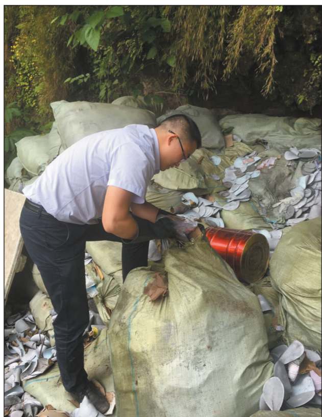
时间:5月9日15:00 地点:重庆市铜梁区北环路建筑垃圾回填场附近