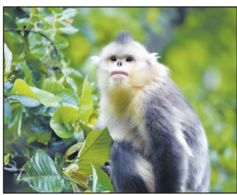
滇金丝猴是中国独有的珍稀濒危物种,被人们称为“雪山精灵”。