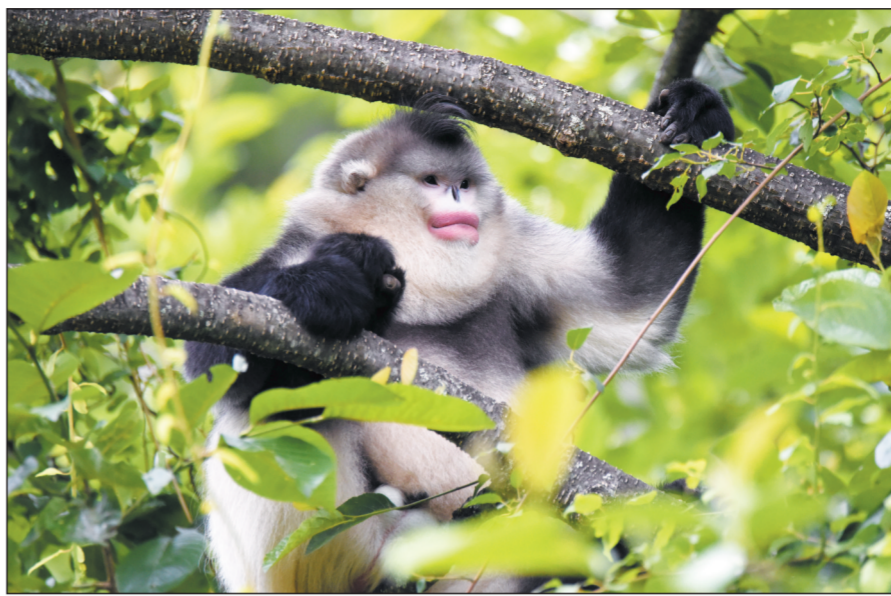
图为云南白马雪山国家级自然保护区塔城响谷箐7号观察点的滇金丝猴。滇金丝猴分布于滇西北和藏东南地区,是世界上海拔分布最高的灵长类动物。