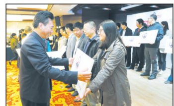
滇金丝猴全境保护网络的建立,将汇集各方智慧,多方联动,全方位提升保护能力,为中国旗舰物种的保护积累经验和树立典范。