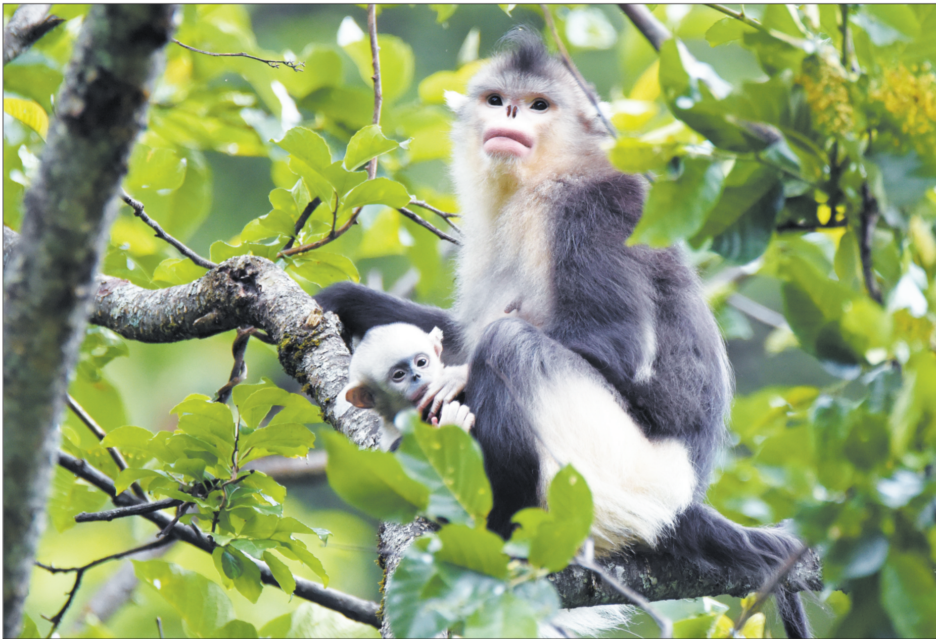
滇金丝猴主食针叶树的嫩叶,也食松萝和桦树的嫩枝芽及幼叶,滇金丝猴每天都需要进食大量松萝,松萝的生长速度异常缓慢,所以上百平方公里的一片云、冷杉林才能满足一个滇金丝猴种群的生存需要。