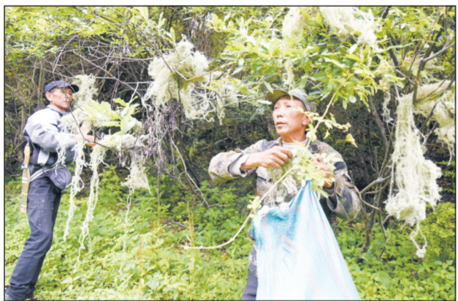
在公益项目支持下,迪庆州分别在县、村成立了滇金丝猴保护县级领导小组和村级管理委员会,丽江市玉龙县组建了民间专业巡护队。