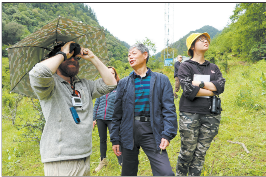
2004年至2008年间,大自然保护协会与政府部门和各基层管理机构合作实施滇金丝猴全境保护项目,开展了种群调查及巡护监测、保护能力建设、信息管理体系建设、社区发展等一系列保护行动,为滇金丝猴全境保护奠定了基础。