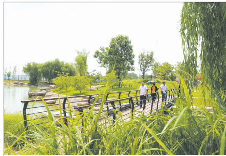
河南省周口市以绿色发展为引领,通过激活内生动力,吸引有实力的企业参与绿色基地项目建设。图为市民在总投资20亿元、占地面积6000余亩的周口建业绿色基地观光旅游。