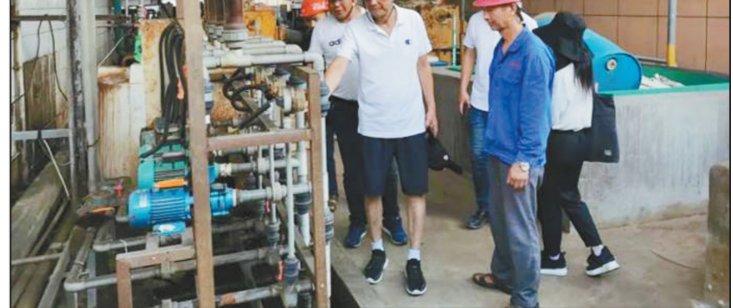
江西省莲花县积极探索一条借助第三方环保技术力量的监管新道路。7月以来,莲花县生态环境部门对重点企业挂点服务,为每家企业量身定制一张“环保病历表”,出具优化整改“药方”。

培训结束后,中国环境科学学会、生态环境部对外合作与交流中心、生态环境部自然生态司、围场县、隆化县的生态扶贫工作队成员还前往塞罕坝机械林场,了解塞罕坝历史与发展,集体向塞罕坝精神学习和致敬。