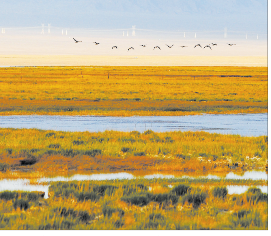
甘肃省酒泉市阿克塞哈萨克族自治县海子湿地草原位于祁连山最西端,近年来,这个县通过设立自然保护区和实施退牧还草及休牧工程,海子片区3个村实施禁牧,同时,实施了草原植被恢复建设项目,灌溉草场9万亩,草原生态得到了休养保护,如今的湿地草原重现了往日美景。

把群众关心的环境问题作为环境治理的“风向标”。河北省生态环境厅围绕扬尘污染、异味污染、建筑施工噪声、秸秆垃圾露天焚烧、农村纳污坑塘、“散乱污”企业排查、机动车及施工机械“冒黑烟”、涉医疗废物违法违规行为、城市黑臭水体、危险废物等10方面,组织全省生态环境系统开展10个专项整治行动,坚持全面排查、精准治理、严格监管、有效整改。