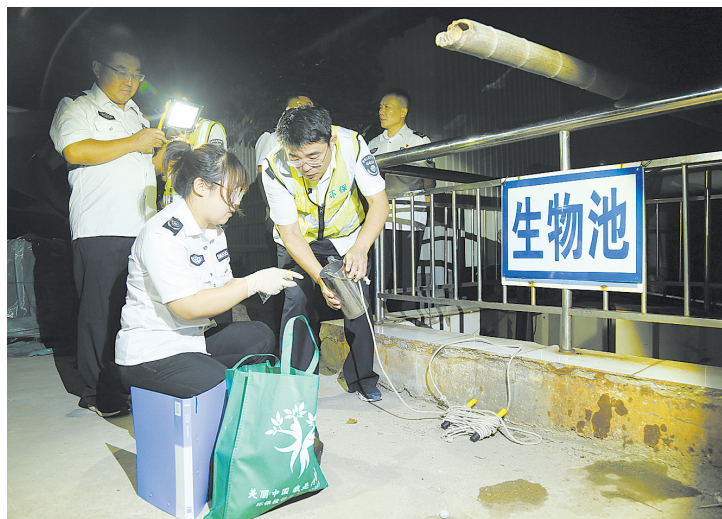
山东省烟台市生态环境局招远分局日前兵分三路,开展执法夜查,特别是对重点信访案件涉及现场进行详细排查。

“流域必须有规划,产业必须有限制,发展要走绿色发展道路。”条例第三章着重平衡水环境保护与经济发展、民生保障两对关系,抓住防治工业污染这一处理水环境保护和经济发展关系的关键,第七条明确,市、县(市、区)人民政府应当根据流域产业发展规划和国家产业结构调整指导目录及重点生态功能区产业准入负面清单等产业政策,调整经济结构,淘汰落后产能,鼓励使用清洁能源,发展绿色经济。“进一步贯彻新发展理念,促进产业转型升级。”法工委相关人士表示。