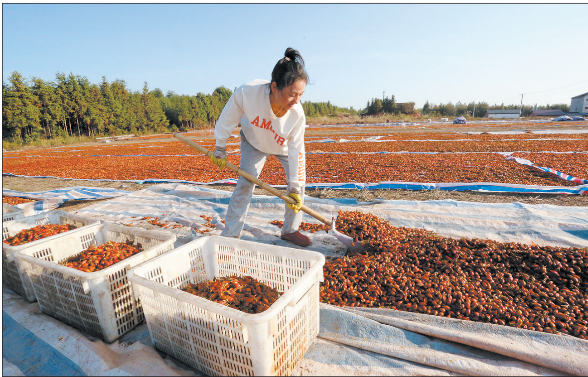
近年来,江西省抚州市金溪县坚持“政府引导、政策扶持、典型示范、群众参与、产业化经营”的工作思路,采取“公司(合作社)+基地+农户(贫困户)”的模式,着力发展蜜桔、蜜梨、黄栀子等特色林果业,既有效防止了水土流失、改善了生态环境,又带动了当地万余户农民脱贫致富。图为双塔镇阳光村村民在收取黄栀子干果。

据了解,河北省21个重点行业中,共有16家企业被评为A级,480家被评为B级,6563家被评为C级。