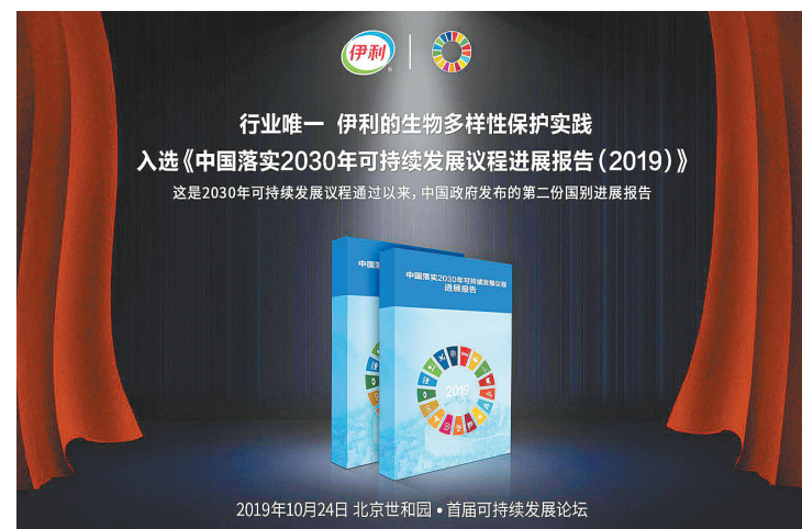
盖全国25个省、32个市,使30万孩子直接受益。从引领中国乳制品企业走向世界,到引领中国乳制品企业可持续发展,伊利在先行先试中探索方向、开拓实践,用一个又一个成

此外,伊利还将责任足迹深入儿童公益领域,已连续7年开展“伊利方舟”儿童安全项目,研发了全国首个校园安全评估指标体系,让每个学校可以根据这个体系识别安全隐患、开展安全教育。截至目前,“伊利方舟”已覆