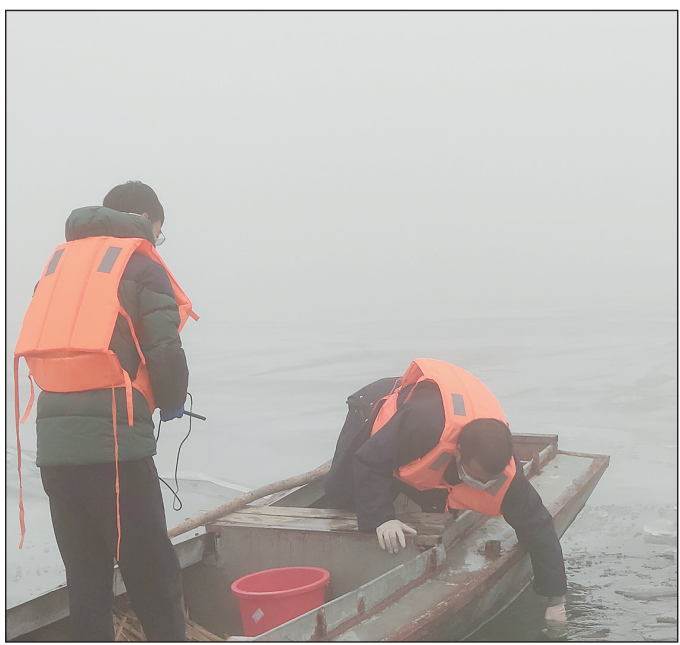
时间:2020年2月13日 地点:白洋淀淀区水质监测点