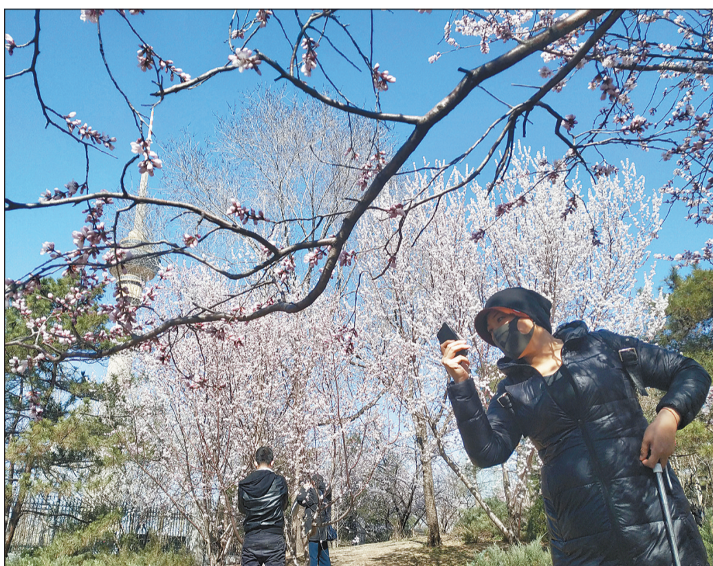
春天到了,熟悉的生活正在慢慢回归。为防控疫情,北京市公园景区采取限流等措施,保证国内游客量控制在往年同期的40%以内。同时,提醒入园游客保持安全距离。图为近日一名市民在北京玉渊潭公园拍摄盛开的桃花。