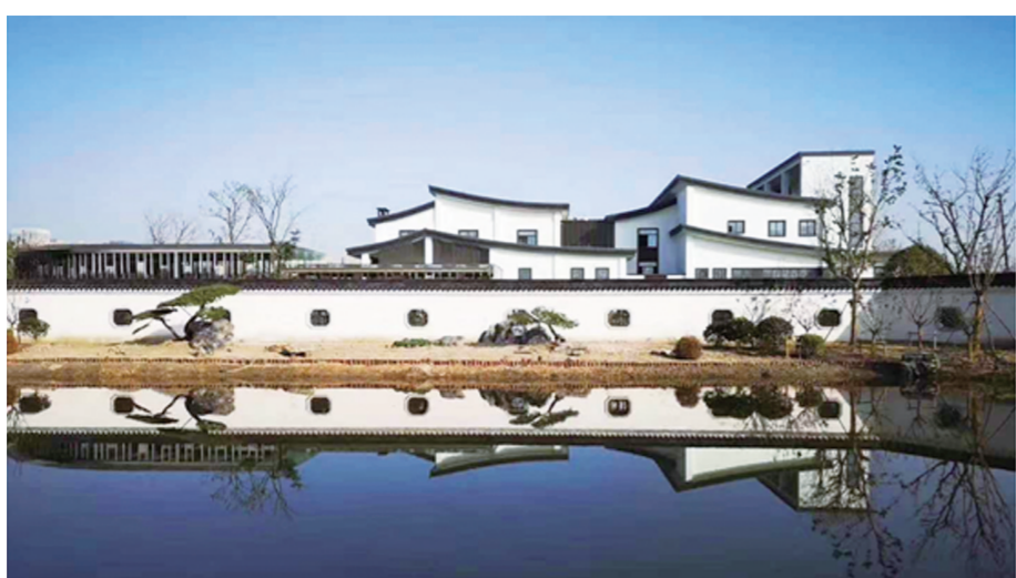
杭州临平净水厂是地下式污水处理厂,采用碧水源膜生物反应器(MBR)工艺。污水处理全程集成在地下进行,地上建筑风格宛若江南园林。