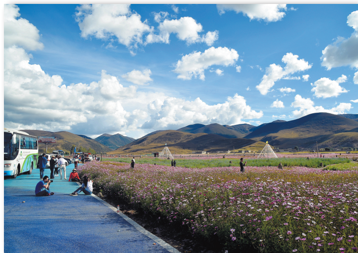
游客来稻城观光旅游。

手捧“旅游饭碗”,亚丁村实现了脱贫,成为稻城县最富有的村子。据了解,2019年,这个村人均可支配收入达4.5万余元,是2010年的6倍多。