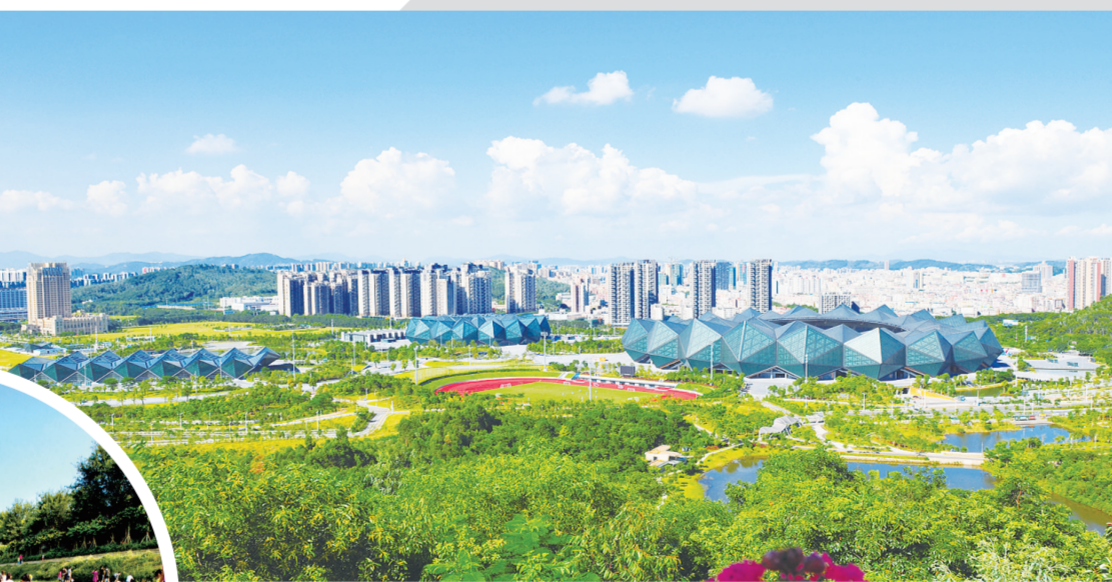
“龙岗蓝”已成为一块金字招牌

构建巡查、整治、执法“三张网”，加强污染源精细化管理。为防止生态文明建设流于形式，龙岗区探索形成现代化治理体系，仅2019年就出动10万余人（次）进行网格化监管，摸清全区两万余家工业企业排污底数并纳入环境统计，对158家重点工业污染源（点位）实施24小时联网监控，全区危险废物利用处置量连续多年100%达标。同时，以“散乱污”整治为重点，以“利剑”行动为抓手，对未批先建等环境违法行为保持高压态势。2019年，共完成“散乱污”排查整治3623家。