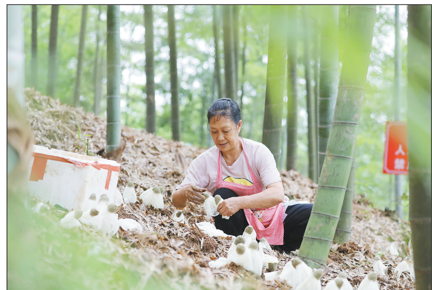
近年来,贵州省赤水市在巩固脱贫攻坚成果中,充分利用当地良好的生态环境和丰富的竹林闲置土地,引导农民在林下套种竹荪,帮助山区群众拓宽了增收渠道。