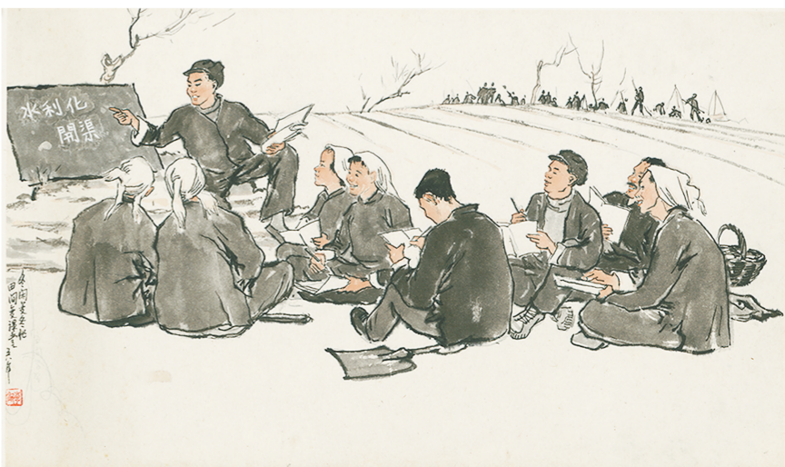
李斛《田间课堂》 纸本设色 中国画 1958年 中国美术馆藏