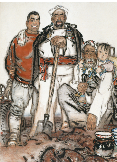
刘文西《祖孙四代》 纸本设色 中国画 1962年 中国美术馆藏