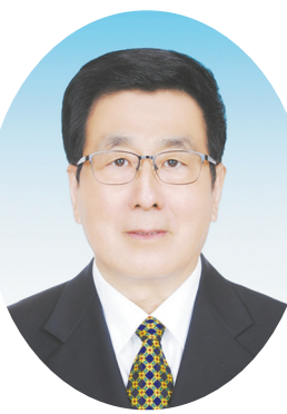
甘肃省委书记 林铎

提高政治站位,鲜明确立生态保护底线任务。甘肃生态战略性、全局性、脆弱性、复杂性特征非常明显,我们明确提出“保护好生态环境就是甘肃对国家和民族最大的贡献”,把生态保护确立为全省必须抓好的两大底线任务之一,切实担好生态文明建设的政治责任和主体责任。把习近平总书记重要批示批示作为全省生态文明建设的统揽和主线,围绕贯彻习近平总书记2019年两次对甘肃重要讲话,召开省委常委会研究制定了两个《决定》,对加强生态环境保护作出系统安排部署。践行习近平总书记“卸下GDP的紧箍咒,套上生态环保的紧箍咒”重要指示要求,积极构建以改善生态环境质量为核心的目标责任体系,取消甘南州、临夏州和75个贫困县的GDP考核,对各地年度考核实行生态环保“一票否决”制度,实打实传导责任和压力。大力宣传古浪县八步沙“六老汉”三代人治沙精神,引导干部群众主动参与和支持生态环境保护。通过这些举措,在全省营造了贯彻习近平总书记重要批示批示精神的浓厚氛围,生态第一、环保优先的观念更鲜明地树立起来。