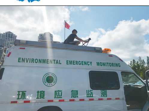
时间:2020年7月27日 地点:重庆市秀山县行政大楼前

在连续下了一个月的暴雨后,重庆市秀山县终于放晴了。县生态环境监测站的工作人员们趁着这难得的大晴天,外出监测功能区噪声。