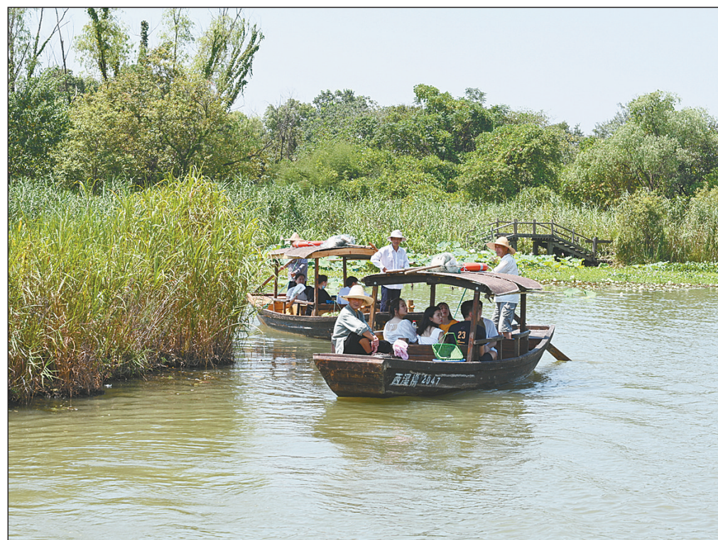
浙江省杭州市西溪湿地是我国第一个集城市湿地、农耕湿地、文化湿地于一体的国家湿地公园。近年来,杭州市坚守生态环境保护底线,强化西溪湿地公园各项保护措施,维护其生态功能和生物多样性。