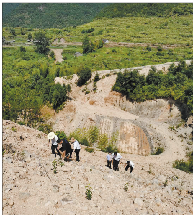
时间:9月5日13:33 地点:中央第三生态环保督察组下沉督察现场