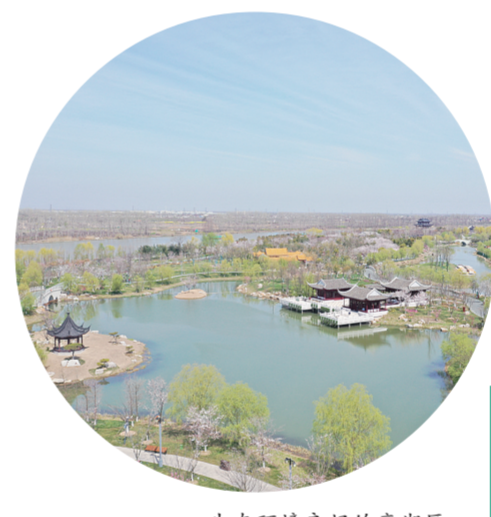
生态环境良好的亭湖区