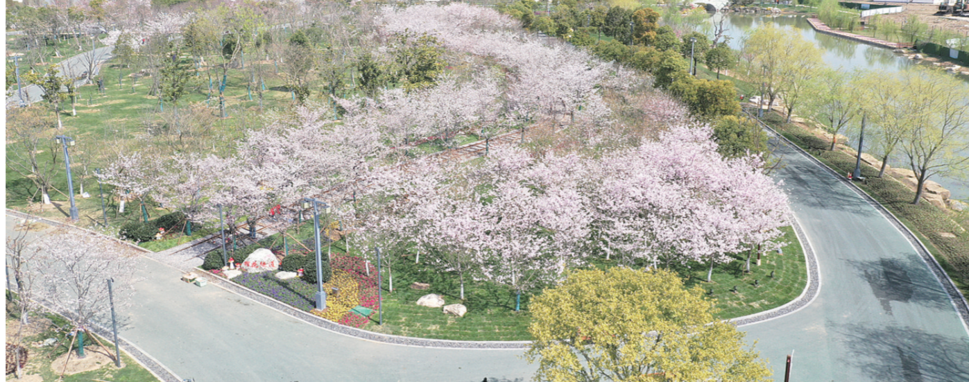
大洋湾景区

作为世界自然遗产盐城黄海湿地的核心区,江苏省盐城市亭湖区深入践行“两山”理论,全面强化世界自然遗产的生态环境保护作用,以良好的生态环境彰显地域特色,积极调整优化生态环境布局、合理安排产业结构、大力发展绿色空间,同步推进亭湖区生态环境“高颜值”和经济发展“高品质”,进一步畅通绿水青山向金山银山的转化通道,为建设美丽江苏提供“亭湖经验”。