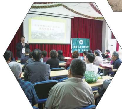
▲青岛市“碧海蓝天”宣讲团为居民带来生动有趣的“环保课堂”