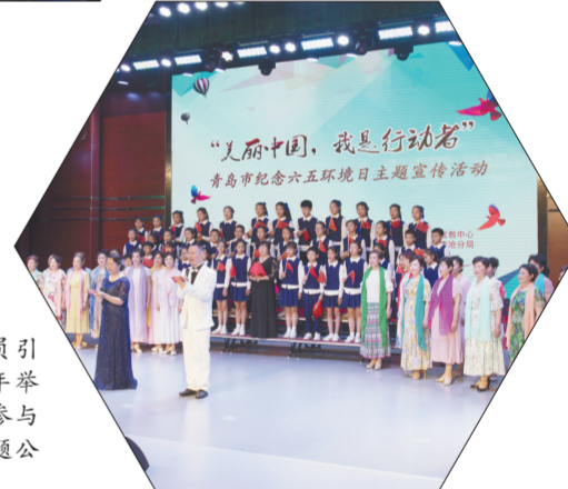
▲在党建动员引领下,青岛市每年举办社会各界广泛参与以生态环境为主题公益宣传活动