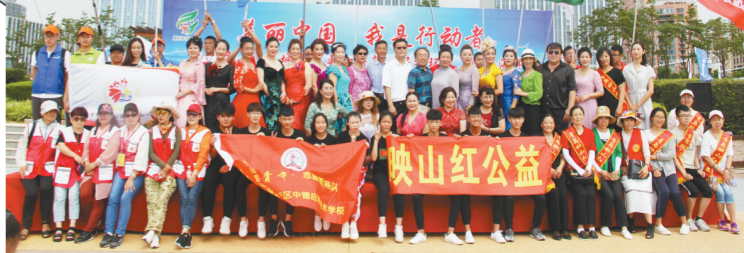
▲联合社会各界连续6年开展“让岛城大海更加蔚蓝——保护海洋你我同行”主题实践活动