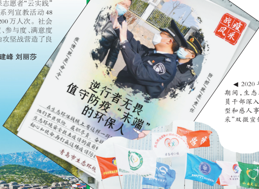
▲2020年新冠疫情防控期间,生态环境宣教中心党员干部深入一线挖掘先进典型和感人事迹,推出“战疫风采”双微宣传专栏