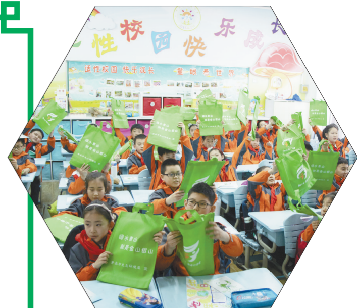
▲青岛市小学生们积极响应“善待地球,从身边小事做起”生态环境保护倡议