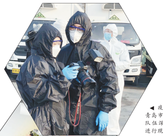
▲疫情期间,青岛市环境宣教队伍深入一线,进行现场报道