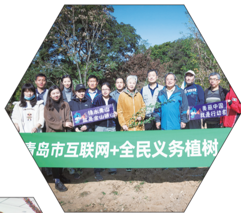
▲青岛市互联网+全民义务植树