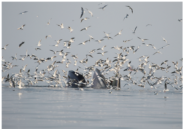
图为露出海平面的布氏鲸。