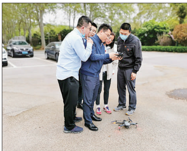
时间：2021年4月9日18:00 地点：河南省郑州市某宾馆