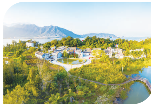
深圳市大鹏半岛坝光片区

“我们计划到2023年年底,新区生态环境保护和经济协同发展取得显著成效。”6月7日,为高质量推进生态环境保护,大鹏新区举办媒体发布会,发布《大鹏新区高质量推进生态环境保护与发展三年行动计划(2021-2023年)》(以下简称“《计划》”),这是大鹏新区进入新发展阶段、贯彻新发展理念、构建新发展格局的系统谋划。