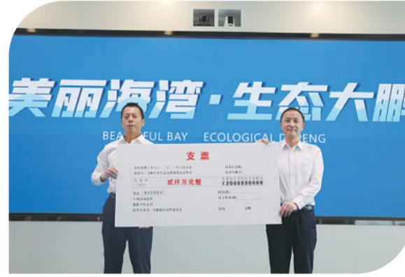
大鹏新区捐赠公益基金——“慈善信托资金”

在2021年环境日和世界海洋日宣传暨大鹏新区高质量推进生态环境保护与发展三年行动计划启动仪式上,大鹏新区将2000万元公益基金“慈善信托资金”赠予大鹏半岛生态文明建设公益基金,并以此启动海洋碳汇增汇工程。