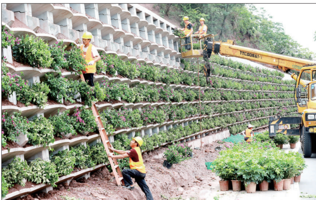
今年以来,四川省眉山市仁寿县在治理道路山体滑坡、边坡塌方上,采用砌筑生态挡土墙的方式,不但消除了道路安全隐患,还起到了涵养水土和美化环境的作用,同时让道路两边变成了靓丽的风景线。

白城市生态环境系统开展“百年辉煌,我心向党”职工排球比赛,通过比赛,进一步增强队伍凝聚力,打造健康体魄,锻造过硬铁军风采。