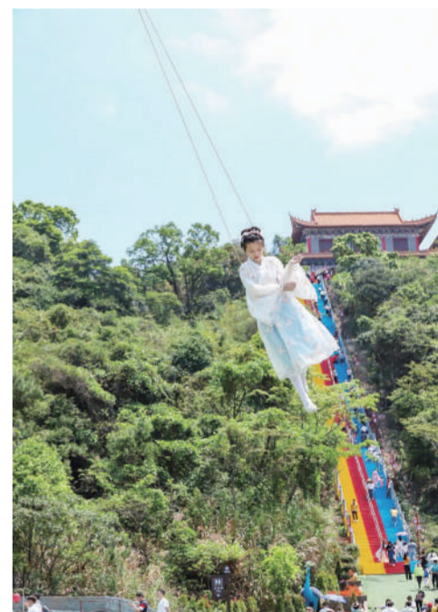
广东省东莞市观山国家森林公园近年来致力于打造生态文化名山,在持续加大生态环保投入的同时,推出创新文旅项目,弘扬传统文化。 肖琪