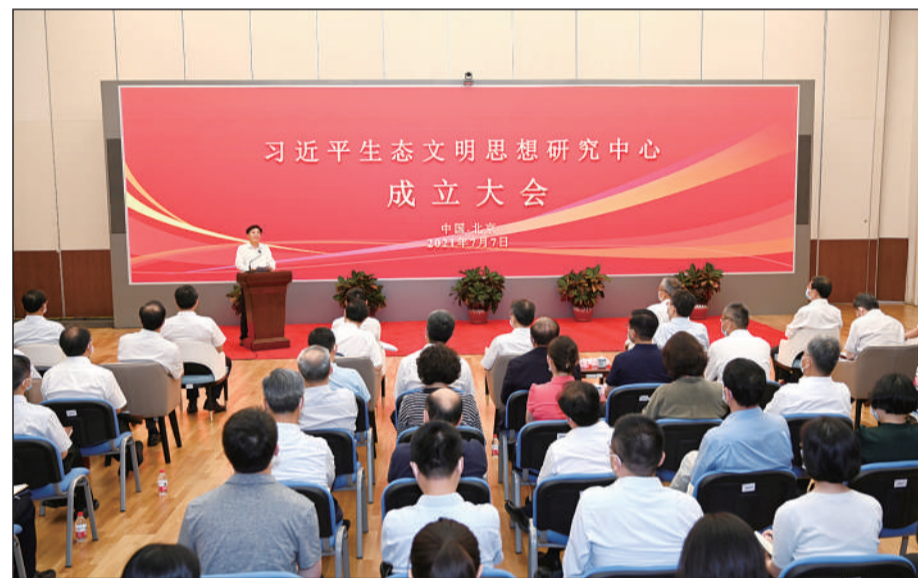
经党中央批准,在生态环境部成立习近平生态文明思想研究中心。7月7日,习近平生态文明思想研究中心成立大会在京召开。

生态环境部党组成员、驻部纪检监察组负责同志,机关各部门、相关直属单位主要负责同志参加大会。