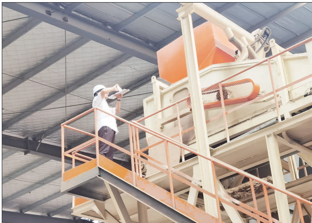
为进一步提高环境管理效能,督促企业严格落实“持证排污、按证排污”主体责任,山东省济宁市生态环境局梁山县分局日前组织开展排污许可专项检查行动,强化排污许可证后管理,提升企业治理水平。图为执法人员现场检查核实企业环境管理情况。

今年下半年,衡水市将持续开展系列专项执法行动,强化部门协调联动,严厉打击各类环境违法行为,进一步推进分表计电安装联网建设应用,加强在线监测系统数据异常排查,大力开展远程执法,完善远程监管,织密织牢“非现场”执法监管网络。进一步夯实网格化监管责任,强化“二、三级重发现”“一级重查处”工作职责,扎实筑牢环环相扣、层层负责的环境保护防线。