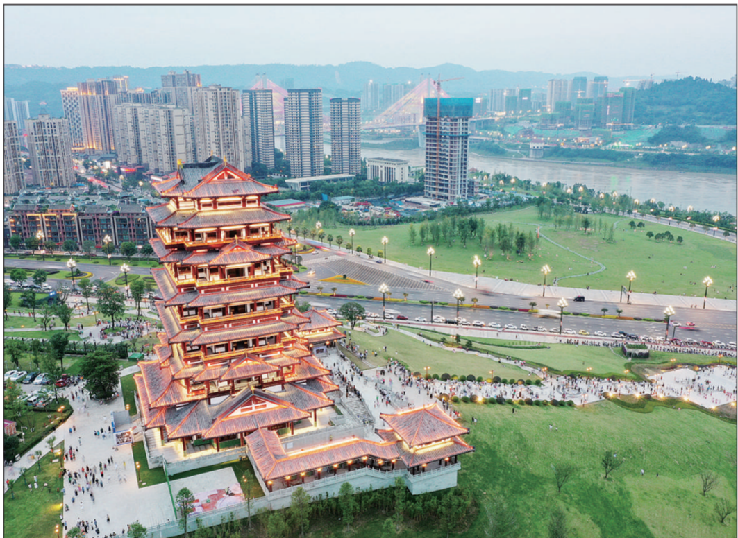
近年来,四川省宜宾市坚持共抓大保护、不搞大开发,始终把生态文明建设放在第一位。积极推进长江生态综合治理项目,规划建设192公里生态廊道,提升宜宾市区域内长江、岷江、金沙江的三江六岸生态环境保护水平,为长江系上“绿腰带”,奋力筑牢长江上游生态屏障。

包钢指出,习近平总书记“七一”重要讲话,高屋建瓴、思想深邃、饱含深情,通篇闪烁着马克思主义真理的光芒,彰显着新时代中国共产党人的崇高历史使命和强烈历史担当,为奋进新时代、走好新征程进