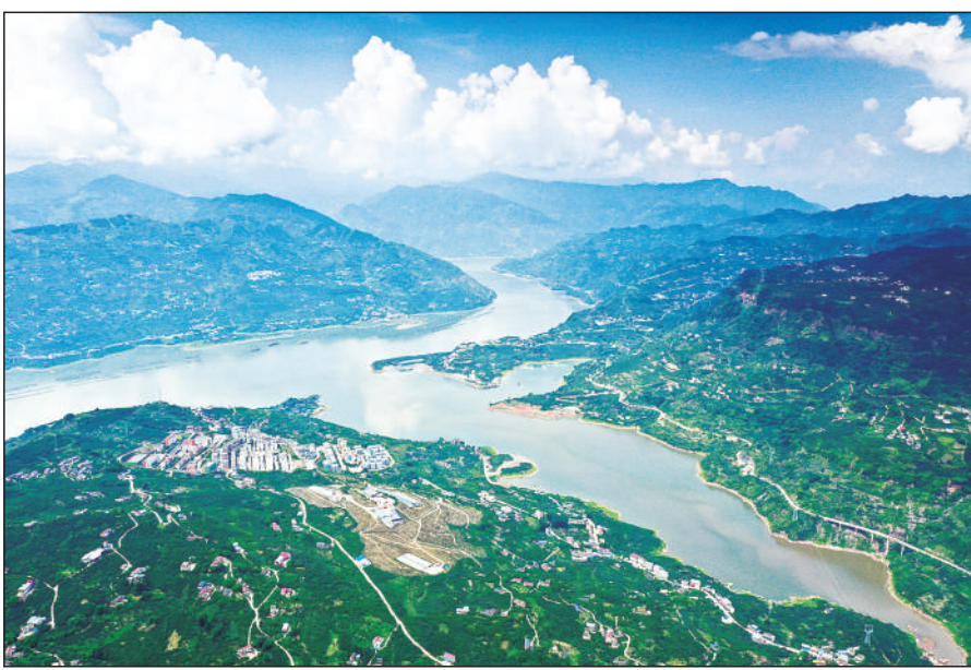
近年来,金沙江向家坝库区发展起百里生态长廊,国内优质水果和茶叶带,处处可见生态美产业兴的景象。图为向家坝电站库区一景。