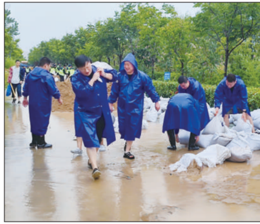
中牟分局组织党员干部群众在贾鲁河岸边防汛抢险,他们分批次轮番上阵,死守任务河段。