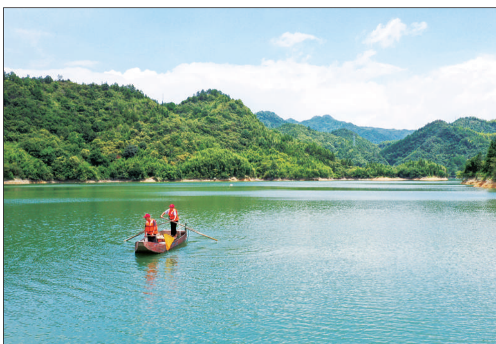
近年来,湖北省咸宁市通城县进一步深化河湖长制工作,构建覆盖县、乡、村、民的四级河(库)长体系,统筹推进水环境、水生态、水资源、水安全、水文化建设,治水观念由单纯的防洪保安向兼顾生态保护转变,并由重治向治管护并重转变,提高了水生态环境质量,形成了全民爱河护河、爱库护库的理念和意识。图为工作人员在打捞水面漂浮物。

河北出台措施推动以生态环境高水平保护服务经济高质量发展 强化政策技术帮扶 完善咨询服务体系